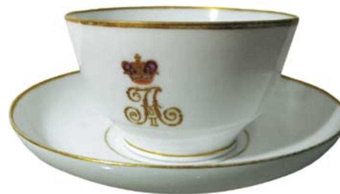
Чашка с вензелем Александра II. ИФЗ. 1902 A cup with a monogram of Alexander II. IPF. 1902