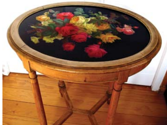
Столешница по проекту Л.Л. Шауфельбергера. ИФЗ. 1880-е. Коллекция семьи (далее — КС) Tabletop on the project of L.L. Shaufelberger. IPF. 1880-s. Family Collection (hereinafter — FC)

IPF produces its products exclusively for the imperial court, thus, the Russian monarchies influenced the development of porcelain production. Alexander II was not particularly interested in porcelain. Besides his guests were allowed to take with them dishes they used