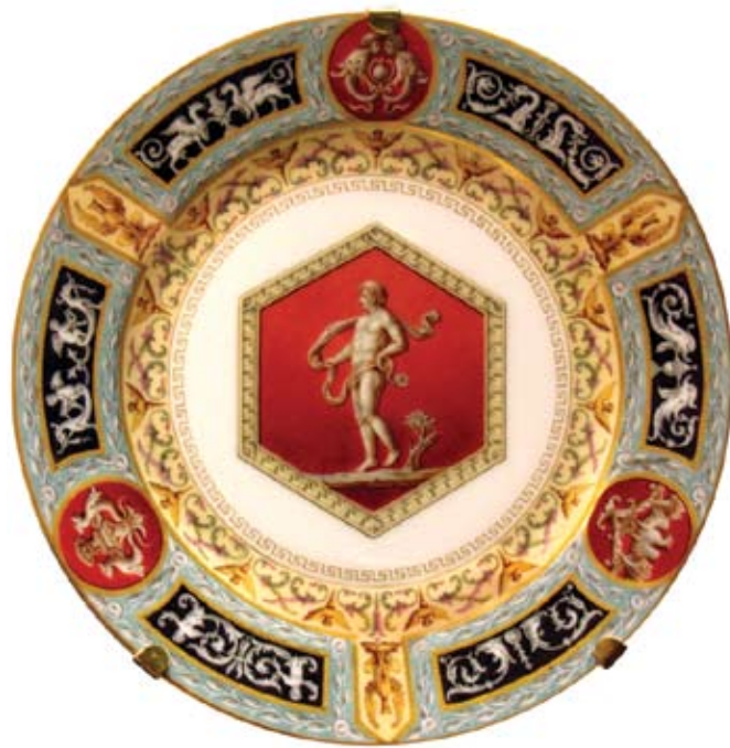
Тарелка из Рафаэлевского сервиза. ИФЗ. 1883–1903. АС Plate from the Rafael service. IPF. 1883–1903. FA

в Интернете копию плана этого кладбища с надписью о том, что план с натурой сверил в ноябре 1881 года архитектор Шауфельбергер.