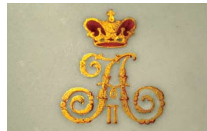
Чашка с вензелем Александра II. ИФЗ. 1902 A cup with a monogram of Alexander II. IPF. 1902