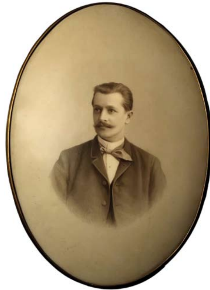
Л.Л. Шауфельбергер. Портрет на фарфоре по фотографии Пасетти. ИФЗ. 1892. КС

In 1872 Siberian Commercial Bank was founded, where my great-