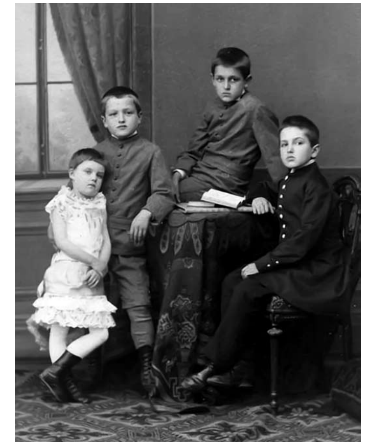
Дети супругов Шауфельбергеров. Фото 1884 г. СА

In 1921, when Lenin realized that building of socialism without capital was impossible in Russia, and military communism was replaced with the New Economic Policy (NEP) promoted an influx of a foreign capital; under the decree of Lenin Arnold Shaufelberger and his friend Kvatnikov started the resurgence of the stock market at the Russian Bank. By way of gratuity the apartment on the Nykolaiivskaya Street